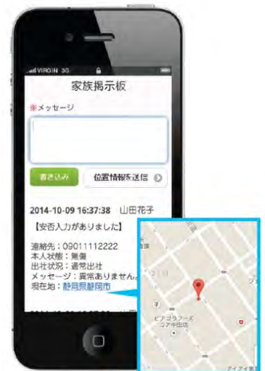
住所をクリックするとブラウザからアプリでマップが表示されます。

7人まで家族を 無料 で登録できます。 家族内だけで使える掲示板があるので、 お互いの安否や居場所などを確認できます。